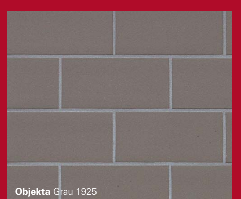
Objekta Grau 1925