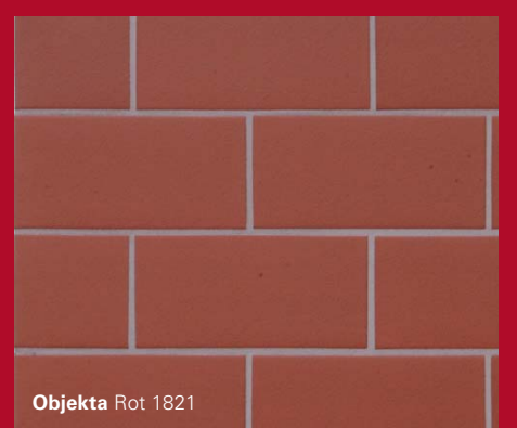
Objekta Rot 1821