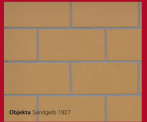
Objekta Sandgelb 1927