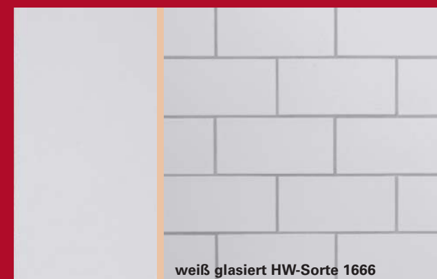
weiß glasiert HW-Sorte 1666