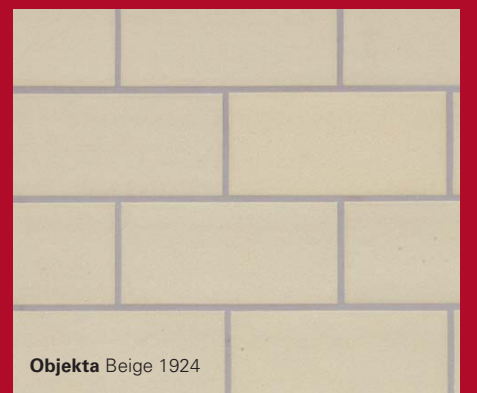
Objekta Beige 1924

Современная напольная керамика для объекта. Напольная керамика подходит для профессиональных, общественных и частных объектов. Равным образом, при высочайшем требовании она хорошо смотрится, износостойка и не требует особого ухода