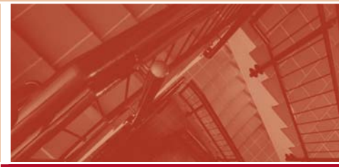
Objekta Beige 1924

Современная напольная керамика для объекта.