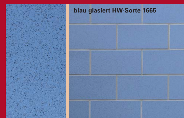
blau glasiert HW-Sorte 1665