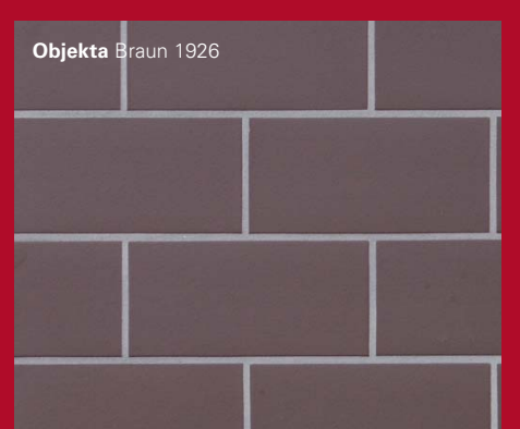
Objekta Braun 1926